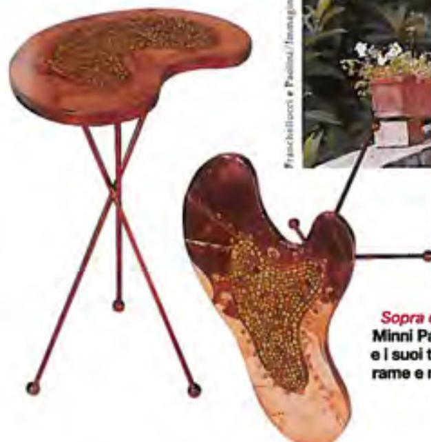
Sopra e a lato: Minni Parravicini e i suoi tavolini in rame e mosalco.

argento, materiale lavico, granate, madreperle o topazi impreziosiscono le lavorazioni di monili dalle fogge arcaiche e di complementi curiosi come ta-