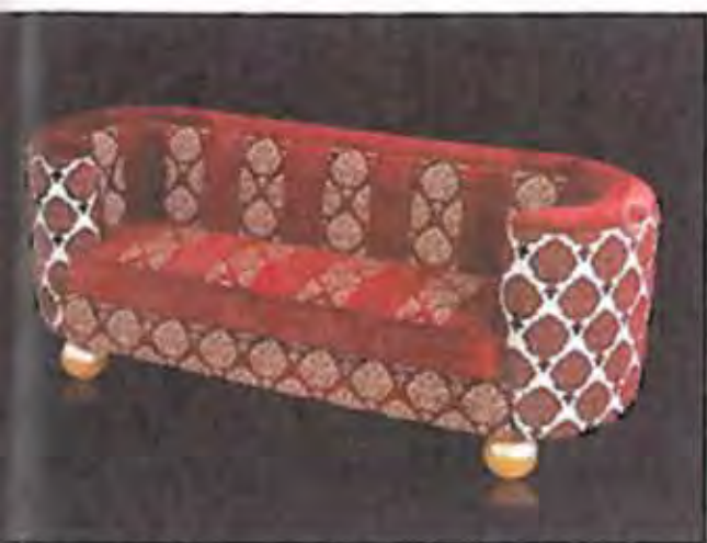
Sopra: divano ABBRACCI A destra: letto OBERON

<< CASSETTIERE, LETTI, DIVANI DAI NOMI DEDICATI A PIANETI E STELLE. FORME GEOMETRICHE CON AMPIO U DELLA SFERA. COLORI PRIMARI SAPIENTEMENTE COORDINATI TRA GIOCHI DI LUCI ED OMBRE >>